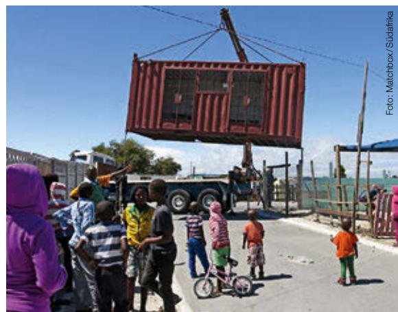
Mit großem Staunen beobachten die Kleinkinder einer Kindertagesstätte in Mfuleni den schweren LKW, der einen umgebauten Container inmitten des beengten Viertels manövriert und auf die kleine Parzelle einer Kindertagesstätte platziert.

Im Jahr 2015 schlossen wir uns der gemeinschaftlichen Initiative des Siedlungswerk Baden an und unterstützten das Hausbauprojekt Chak 412 in Pakistan.