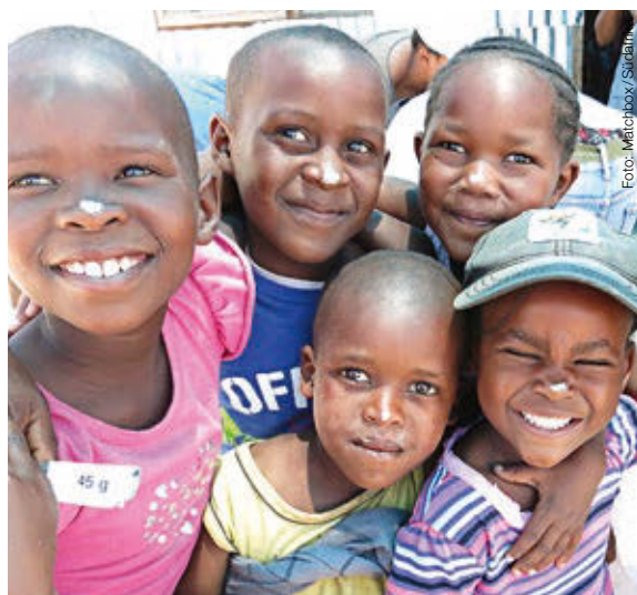
Einige der Kleinkinder und Schulkinder der Kindertagesstätte Likhona, die Dank der Spenden aus Deutschland jeden Tag gut betreut werden können. So gut, dass sie sorglos und ausgelassen spielen und lachen können.

Seit 32 Jahren unterstützt die Baugenossenschaft Familienheim Baden-Baden eG die Projekte der DESWOS Deutsche Entwicklungshilfe für soziales Wohnungs- und Siedlungswesen e.V. als Mitglied und Förderer. Über die DESWOS erweitern und bekräftigen wir unser sozial verantwortliches Handeln. Denn mit dem Mitgliedsbeitrag und den Spenden fördern wir die soziale und wirtschaftliche Entwicklung der Menschen in den Projekten in Afrika, Asien und Lateinamerika.