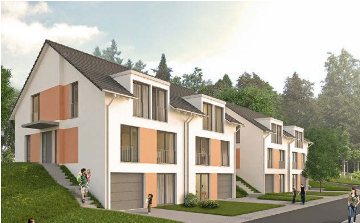
Modellansicht Langenäcker 18 – 24

Baugenossenschaft Familienheim Baden-Baden eG baut vier weitere Doppelhaushälften.