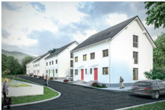
Modellansicht Darnieweg 1 – 1 g

Baugenossenschaft Familienheim Baden-Baden eG baut acht weitere Doppelhaushälften.